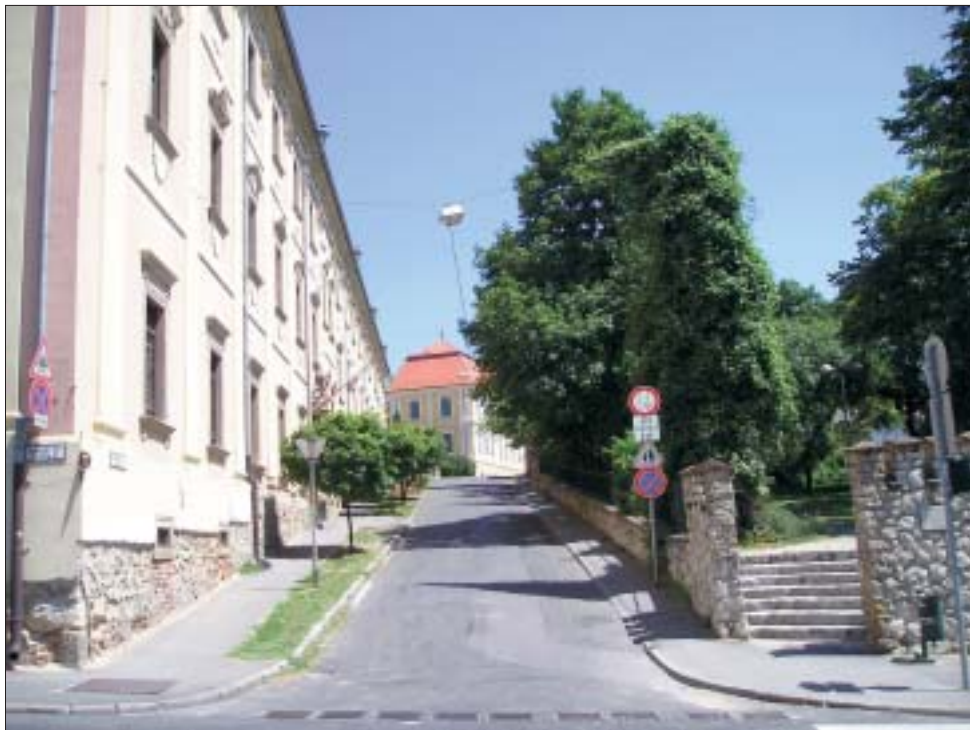
Háttérben a Nagy Kiállítótér leendő helye a Papnövelde utcában

A megyei önkormányzat és Pécs városa 2002-ben létrehozta a Baranya Ifjúságért Kht.-t, amely ellátási szerződés alapján gondoskodik a megyében élő gyermekek és fiatalok számára információs és tanácsadó szolgáltatások igénybevételi lehetőségéről. A megyei önkormányzat a feladatok ellátásához működési támogatást, térítésmentes székhely és irodahelyiség használatot, valamint a kiírt nemzet-