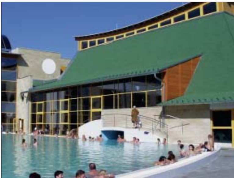
A felújított harkányi gyógyfürdő egyik medencéje 2003-ban