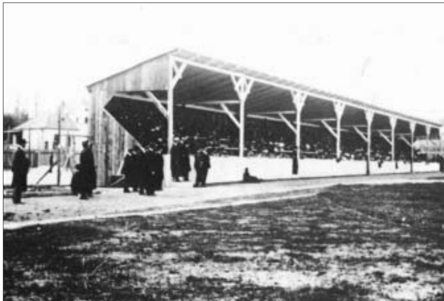
A Ráth utcai stadion lelátója az 1920-as években

a válogatottakkal teli tüzdelt Hungária ellen is sikerült az 1:1-es döntetlen. Végül az idényben a 12 csapatból, 22 mérkőzést játszva, 5 győzelemmel, 7 döntetlennel és 10 vereséggel 31:50-es gólaránnyal, 17 ponttal kilencedikként sikerült bent maradni az első ligában, bár az 50 kapott gól figyelmeztető jel volt, ennél csak két csapat hálójában zörgött többször a labda. Az idény alatt a pénzügyi nehézségek csak fokozódtak, a játékosokat csak részben tudták kifi-