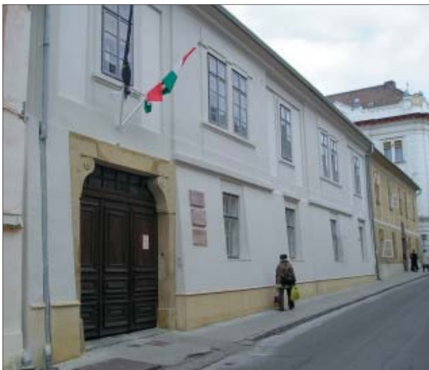
A megújult Csorba Győző Megyei Könyvtár épülete az Apáca utcában

ségi politika. A legutóbbi választások során – a Magyarországon törvényileg elismert 13 honos népcsoport közül – a megye 190 településén 9 kisebbség, összesen 238 kisebbségi önkormányzatot hozott létre. A megyei önkormányzat által vállalt, elsősorban koordináló szerepvállalás jeles példája, hogy 2003-ban megalakult és azóta is folyamatosan működik a Baranya Megyei Cigány Integrációs Tanács. Célja a konzultáció, párbeszéd előmozdítása, biztosítása a roma és nem roma lakosság között. A célszerűség, eredményesség és hasznosság elvei mentén a nemzetközi és ezen belül a testvérmegyei kapcsolatok fejlesztésében fokozatosan előtérbe került a projektszemlélet, az együttműködési tárgyalások során kiemelt hangsúlyt kaptak a megnyíló ún. források hasznosításának közös lehetőségei. Az Alpok-Adria Munkaközösség soros elnökségi feladatait 2004. év novemberében vette át két évre a Baranya Megyei