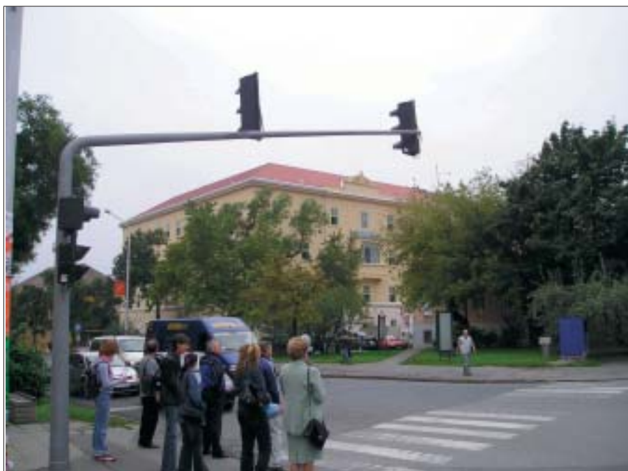
A Megyei Kórház rekonstrukció után – 2006-ban

Az M/6-os és az M/60-as 2x2 sávós gyorsforgalmi út baranyai szakaszaira az engedélyezési tervek rendelkezésre állnak, megkezdődtek a régészeti kutatások is. A terveknek megfelelően zajlik a Pécs-Pogányi Repülőtér beruházási projekt. Menetrendszerinti járatot üzemel az Austrian Airlines Pécs-Bécs viszonylatban, folyamatban van a repülőklub új bázisának kialakítása, illetve a repülőtér műszaki infrastruktúrájának fejlesztése.