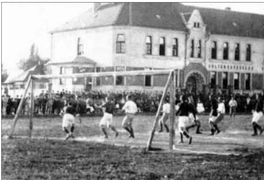
Mérkőzés a Ráth utcai (ma József Attila utca) stadionban, háttérben a már megépült Gyermekklinikával