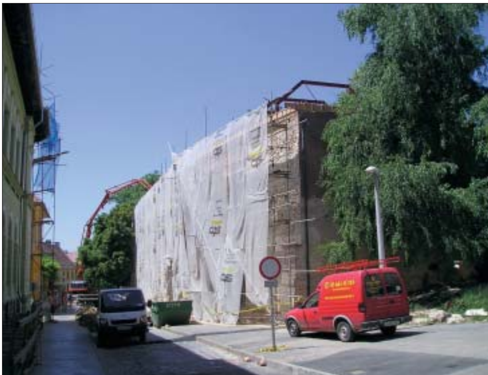
Folyik a Zsolnay Múzeum teljes felújítása 2006 júliusában

Deviancia Prevenció, Regionális Képzési és Koordinációs Központ, mely országosan egyedülálló abból a szempontból, hogy intézményesíti a preventív tevékenységet. Az intézményrendszer átalakításának egyik legjelentősebb lépéseként a megyében befejeződött a „kastélykiváltási” program. Az intézményhálózat jelenleg 24 telephelyből áll. A különleges ellátás önálló nor-