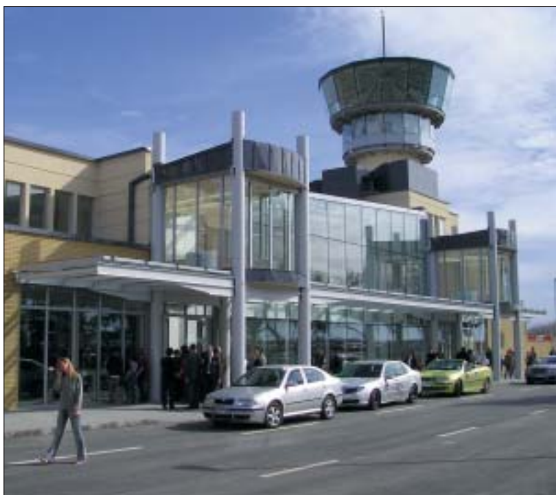
A Pécs-Pogányi Repülőtér terminálja 2006 májusában

együttműködés jöhet létre (így: Észak Zsupánság – Baranya – Észak Megye, Devon – Baranya – Kovászna).