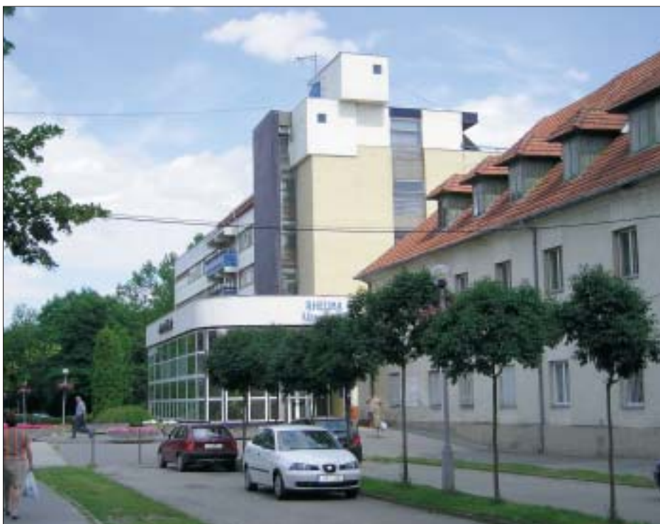
A Harkányi Gyógyfürdőkórház főépülete

Vasarely-gyűjtemény, a villányi szoborpark, a magyar és nemzetiségi hagyományokat megörökítő tájházak. A Zsolnay Múzeum régóta esedékes felújítását az elnyert, több mint 400 millió forintos címzett támogatás segítségével kezdhette meg az önkormányzat. Az elmúlt három évben megújult a Baranyai Alkotótelepek Kht. tevékenysége, fémjelzi ezt az egyre több szimpózium, program megszervezése, a szoborpark idegenforgalomba való fokozottabb bevonása, a Gyimóthy villa felújítása. A Pannon Magyar Ház több jelentős rendezvénnyel járult hozzá a határon túli magyarsággal való kapcsolatrendszer erősítéséhez.