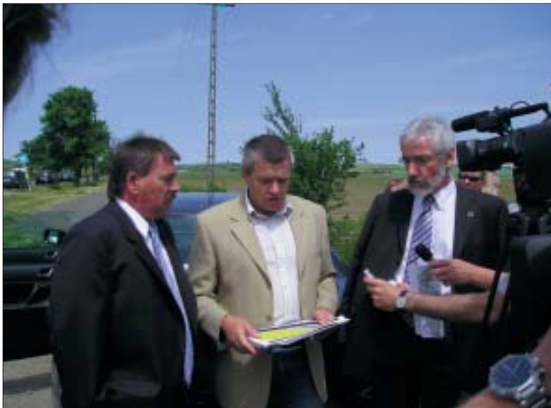
Sajtótájékoztató az M6-os autópálya leendő bolyi elágazásánál 2005 júniusában

Sportszövetségét is, mely szervezetnek az élősport támogatás keretén belül nyújtott pénzügyi támogatást. A megyei önkormányzat a három sportcélú szervezet tevékenységéhez irodahelyiségeket alakított ki és működtet Pécsen, berendezési tárgyakat bocsátott rendelkezésükre, valamint internetes hozzáférési lehetőséget biztosított. Ennek összköltsége évente közel 10.000 ezer forint összegben számszerűsíthe-